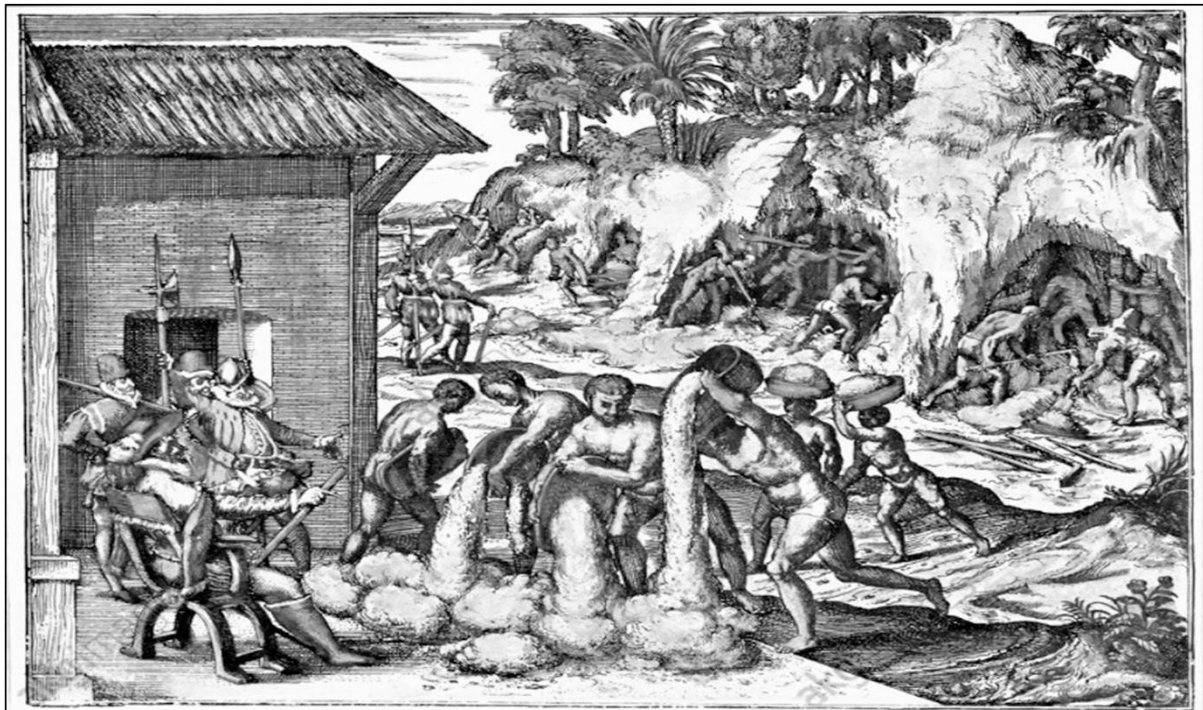
Σκλάβοι από την Αφρική εργάζονται σε ορυχεία χρυσού στην ισπανική αποικία του Αγίου Δομήνικου (Γκραβούρα του Theodor de Bry, 1595)

Πηγή: P. Chaunu, L' Amerique et les Ameriques , Armand Colin, 1964, σ. 103 – 107 (δημοσίευση στα ελληνικά στο βιβλίο Μεσαιωνική και Νεότερη Ιστορία Β΄ Γυμνασίου )